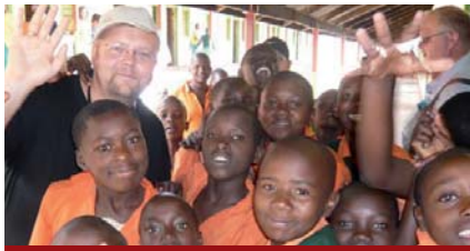
Höfundur í góðum félagsskap

Aðventa er tími væntinga. Við horfum til jólahátíðar, sem er ljóssins hátíð, fæðingarhátíð Jesú Krists. Engin manneskja er undanþegin því að bera ákveðnar væntingar til lífsins, annars yrði víst lítið um vonbrigði. En hvernig væntingar eigum við að bera til lífsins? Þeir velferðartímar, sem við íslensk þjóð höfum lifað undanfarin ár, hafa falið í sér uppfyllingu margvíslegra væntinga í efnahagslegu tilliti og er það vel. En það er ekki hægt að reiða sig á efnahagslega velferð eins og reynslan sýnir og hefur margoft sýnt. Það er einmitt vegna þess að mölur og ryð eyðir fjársjóði á jörðu, en ekki himneskum fjársjóði eins og Frelsarinn orðaði það í Biblíunni. Himneskur fjársjóður eru m.a. tilfinningaleg gildi og tengsl. Ósjaldan verða slík gildi okkur ljós þegar efnahagur hrynur, það er hið jákvæða í stöðunni. Með það í huga lítum við til þess að sterkari stoðir liggja að baki væntingum til hins himneska fjársjóðs, heldur en hins jarðneska. Væntingarnar, sem við berum til innihalds kristinnar