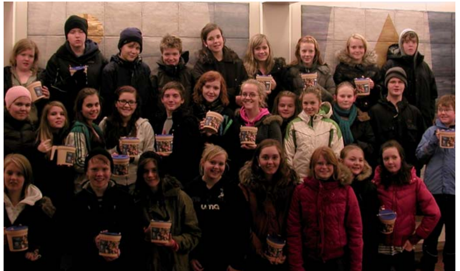
Glaðir félagar SELA við söfnun Hjálparstarfs kirkjunnar

Á þessu hausti hefur sameiginlega verið unnið í Reykjavíkurprófastsdæmum að fylgjast með hversu margir koma til sóknarkirknanna. Í Seljakirkju höfum við tekið átt í þeirri talningu og fylgst með hversu margir sækja starfsemi í kirkjumíðstöðinni. Alla daga vikunnar er þar margháttað starfsemi. Þær tölur sýna að vikulega koma liðlega þúsund manns til starfs og þátttöku í starfsemi kirkjunnar. Að því viðbættu er margar vikur, þar sem svo margar athafnir eru að talan hækkar verulega. Það er mikill misskilningur að kirkjumíðstöðvarnar séu ekki mikið notaðar. Slíkt fullyrða þeir einir sem ekkert þekkja til þess sem þeir fullyrða um. En það er fengur fyrir okkur sem eigum Seljakirkju að þar megum við njóta góðra stunda. Það skyldum við nýta okkur vel.