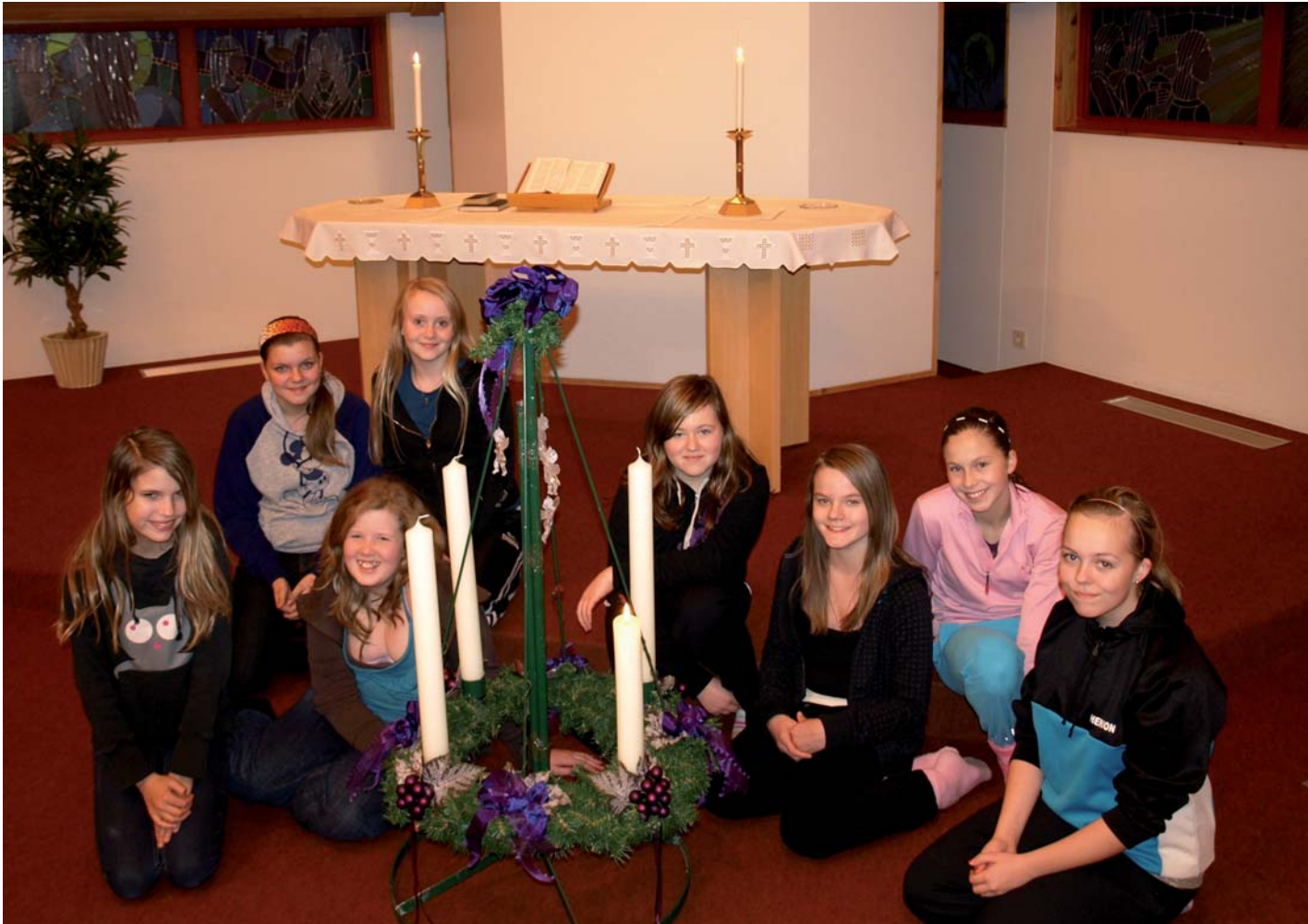
Aðventuundirbúningur í Seljakirkju

Kynnið ykkur aðventudagskrá Seljakirkju á baksíðu